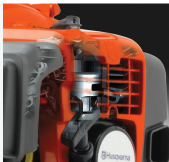
X-Torq® Motor Der X-Torq® Motor sorgt für hohes Drehmoment über einen breiten Drehzahlbereich und erzeugt 20% weniger Kraftstoffverbrauch und 75% geringere Schadstoffemissionen.