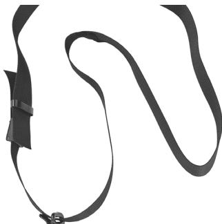
Tragegurt Diagonal Standardgurt für leichte Freischneider

Der Husqvarna 535RJ ist eine leistungsstarke Motorsense mit J-Handgriff. Ausgerüstet mit X-Torq® Motor, welcher ein hohes Drehmoment über einen breiten Drehzahlbereich bietet und sich durch bis zu 20% niedrigeren Kraftstoffverbrauch sowie 75% geringere Schadstoffemissionen auszeichnet. Gute Ergonomie und lange Lebensdauer sind weitere typische Merkmale für diese Maschine.