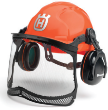
SCHUTZHELM CLASSIC 580 75 43-01