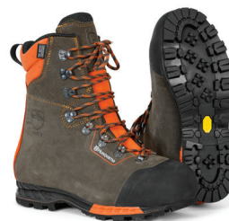
SCHUTZSTIEFEL FUNCTIONAL 24M/S 597 65 93-42