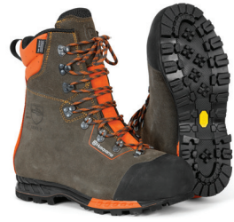
SCHUTZSTIEFEL FUNCTIONAL 24M/S 597 65 93-47