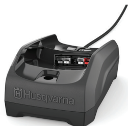
AKKU-LADEGERÄT 40-C80 970 48 78-01