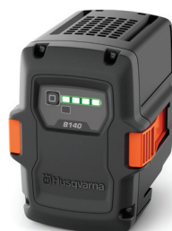
AKKU 40-B140 970 45 72-01