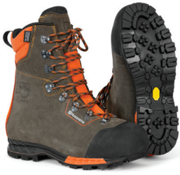
SCHUTZSTIEFEL FUNCTIONAL 24M/S 597 65 93-44