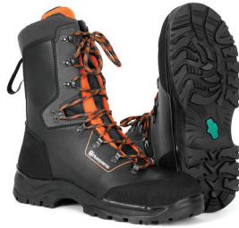
SCHUTZSTIEFEL CLASSIC 20M/S 597 65 94-41