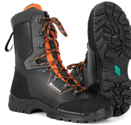
SCHUTZSTIEFEL CLASSIC 20M/S 597 65 94-42