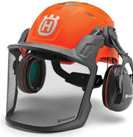
SCHUTZHELM TECHNICAL 585 05 84-01