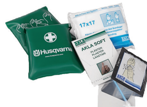
ERSTE-HILFE-KIT 504 09 53-01