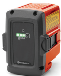
AKKU BLI20 967 09 17-01