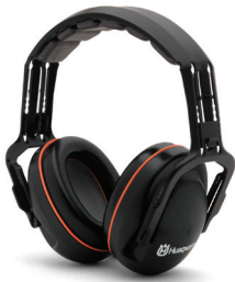
GEHÖRSCHUTZ 505 66 53-04