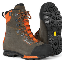
SCHUTZSTIEFEL FUNCTIONAL 24M/S 597 65 93-41