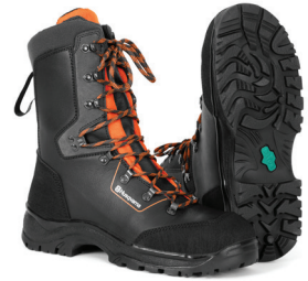
SCHUTZSTIEFEL CLASSIC 20M/S 597 65 94-43