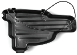
KETTENSÄGENUNTERSATZ 536 94 48-01