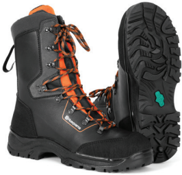
SCHUTZSTIEFEL CLASSIC 20M/S 597 65 94-40