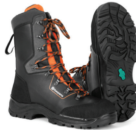
SCHUTZSTIEFEL CLASSIC 20M/S 597 65 94-46