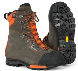
SCHUTZSTIEFEL FUNCTIONAL 24M/S 597 65 93-39