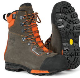
SCHUTZSTIEFEL FUNCTIONAL 24M/S 597 65 93-46