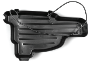
KETTENSÄGENUNTERSATZ 536 94 48-02