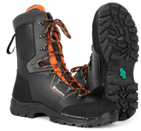
SCHUTZSTIEFEL CLASSIC 20M/S 597 65 94-39