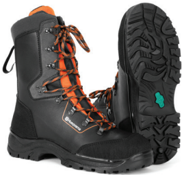
SCHUTZSTIEFEL CLASSIC 20M/S 597 65 94-44