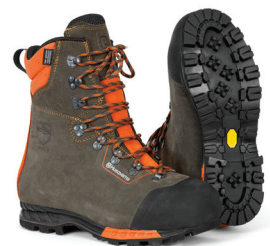
SCHUTZSTIEFEL FUNCTIONAL 24M/S 597 65 93-43