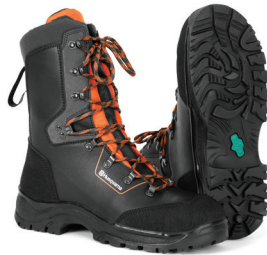
SCHUTZSTIEFEL CLASSIC 20M/S 597 65 94-45