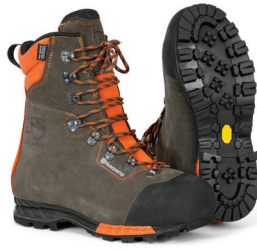
SCHUTZSTIEFEL FUNCTIONAL 24M/S 597 65 93-45