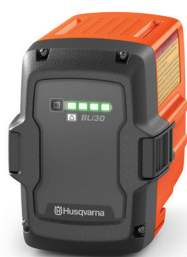
AKKU BLI30 967 93 77-01