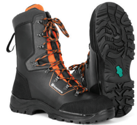
SCHUTZSTIEFEL CLASSIC 20M/S 597 65 94-47