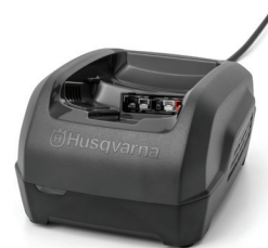
AKKU-LADEGERÄT QC250 967 97 01-01