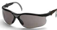
SCHUTZBRILLE, SUN X 544 96 37-03