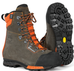
SCHUTZSTIEFEL FUNCTIONAL 24M/S 597 65 93-40