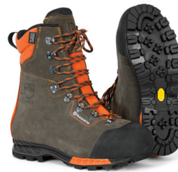
SCHUTZSTIEFEL FUNCTIONAL 24M/S 597 65 93-38