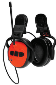
GEHÖRSCHUTZ MIT RADIO 578 27 49-04