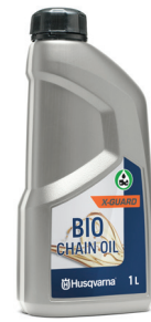
KETTENÖL BIO X-GUARD 596 45 73-01