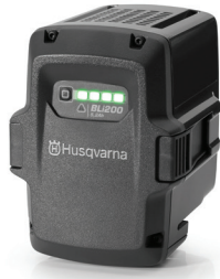
AKKU BLI200 967 09 19-01