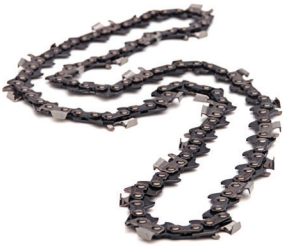
KETTE H00 1/4" HM 501 84 40-64