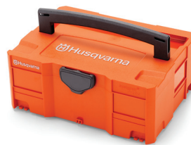
AKKU-BOX S 585 42 87-01