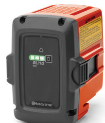
AKKU BLI10 967 09 16-01