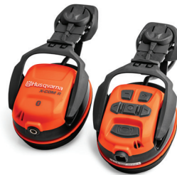
GEHÖRSCHUTZ X-COM R 595 08 42-01