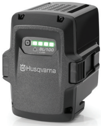
AKKU BLI100 967 09 18-01