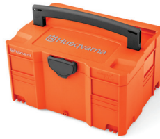
AKKU-BOX M 597 16 85-01