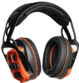
GEHÖRSCHUTZ X-COM R 595 08 40-01