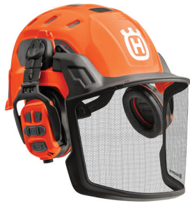
SCHUTZHELM X-COM R 595 08 43-01