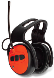
GEHÖRSCHUTZ MIT RADIO 578 27 49-03