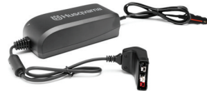
AKKU-LADEGERÄT QC80F 967 62 83-01