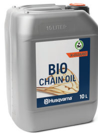
KETTENÖL BIO X-GUARD 596 45 73-03