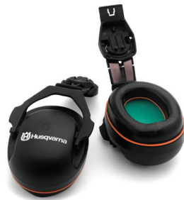
GEHÖRSCHUTZ, BEFESTIGUNG AM HELM 505 66 53-25