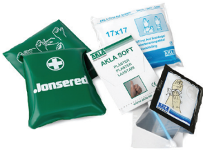
ERSTE-HILFE-KIT 502 52 55-01