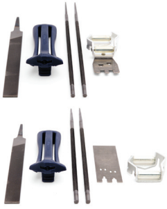
FEILENKIT 580 68 75-01