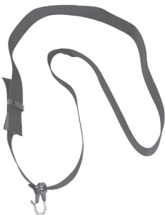
TRAGEGURT DIAGONAL 537 21 62-01