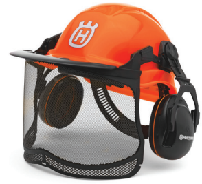
SCHUTZHELM FUNCTIONAL 576 41 24-01