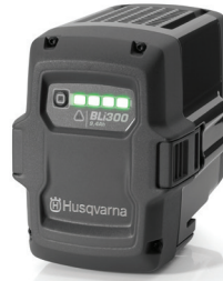
AKKU BLI300 967 07 19-01