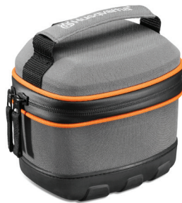
AKKU-TASCHE 585 37 18-01