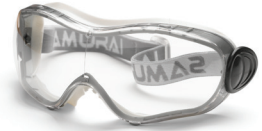
SCHUTZBRILLE, GOGGLES 544 96 39-01