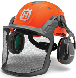
SCHUTZHELM TECHNICAL 585 05 84-01