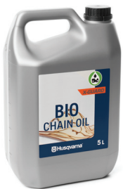
KETTENÖL BIO X-GUARD 596 45 73-02