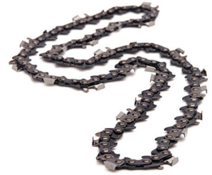
KETTE H00 1/4" HM 501 84 40-58