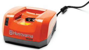
AKKU-LADEGERÄT QC330 967 09 14-06