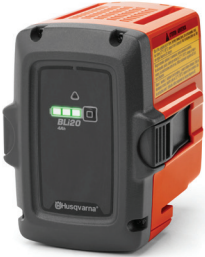
AKKU BLI20 967 09 17-01